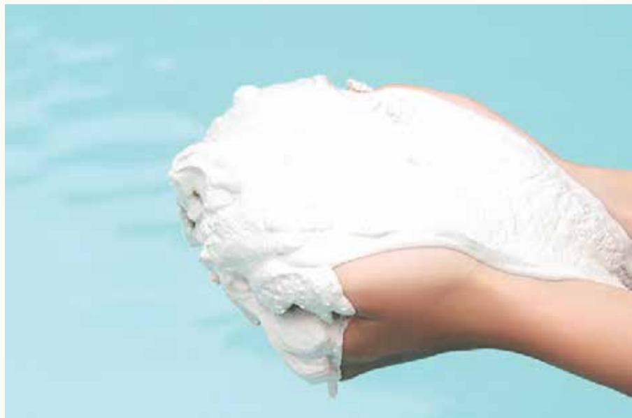
牛奶湖 Milky Way

千年前火山爆發所噴出的火山灰經長年累月的沉積而形成，特殊的地貌，因湖水呈乳白色猶如牛奶，故稱「牛奶湖」，湖水有淡淡的硫磺味，湖底富含礦物質的火山泥，據說有美肌的功效！